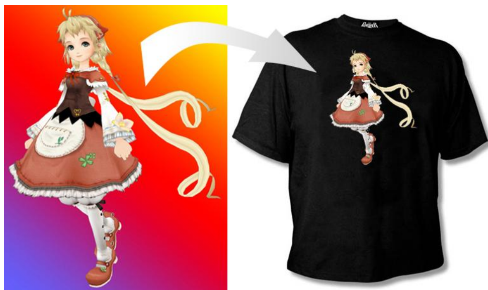
Imagen de partida y desarrollo del proceso

Partimos con una imagen compuesta por contornos definidos